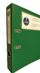
Pasta da secretaria

Estes Planos encontram-se, para consulta de todos, na secretaria e no site da igreja, no item Ministérios.