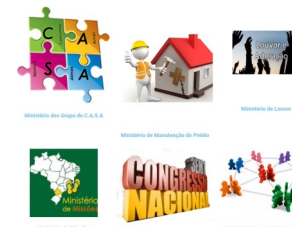
Site da Igreja